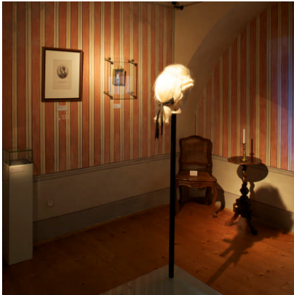
Sanierung des Haydn-Zentrums, Eisenstadt