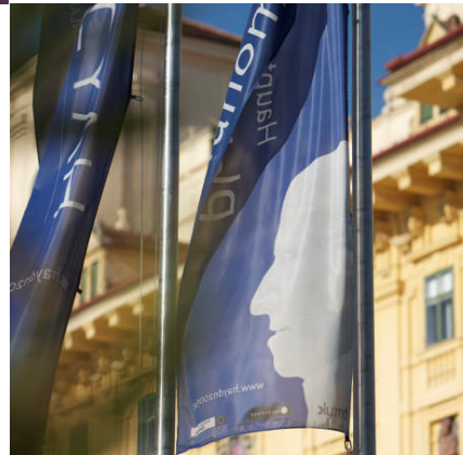
Öffentlichkeitsarbeit und Marketing für das Haydnjahr 2009, Joseph Haydn Burgenland GmbH