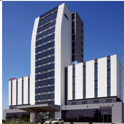
Pannonia Tower, Parndorf