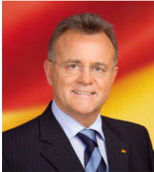
Hans Niessl Landeshauptmann

Die burgenländische Wirtschaft war 2009 vor allem durch die Wirtschaftskrise geprägt. Allerdings konnten bis Ende 2009 mehr als € 180 Mio. an Investitionen nur durch die Phasing Out-Programme angestoßen werden. Dahinter stehen über 1.600 Projekte, mit denen die Modernisierung der Wirtschaft im Burgenland fortgesetzt wird. Die Palette reicht von der Firma Zoerkler Gears GmbH & Co KG mit einer Investition von über € 14 Mio. bis zu einem geförderten Ungarisch-Kurs mit Kosten von € 85,-.