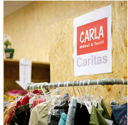
Caritas-Laden der Diözese Eisenstadt