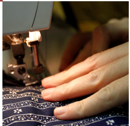
Verein Koryphäen, Neusiedl am See