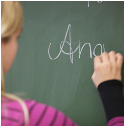
Einrichtung regionaler Learning Centers, Burgenländische Volkshochschulen