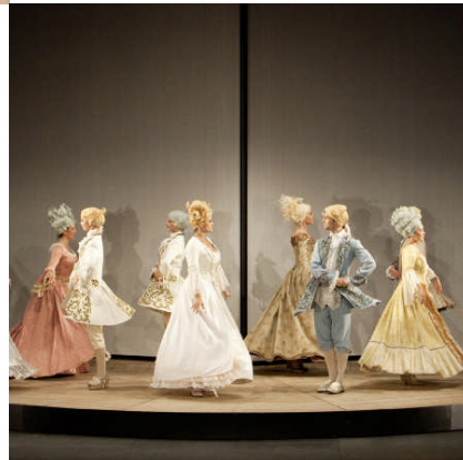
Errichtung einer Drehbühne, Schloss-Spiele Kobersdorf