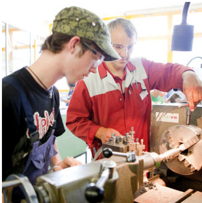
Lehrwerkstätte Mitte/Nord, BUZ Neutal