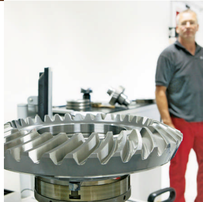
Zoerkler Gears GmbH & Co KG, Jois